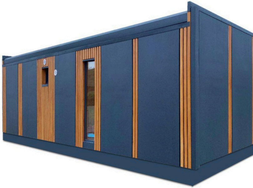
Vue arrière 2