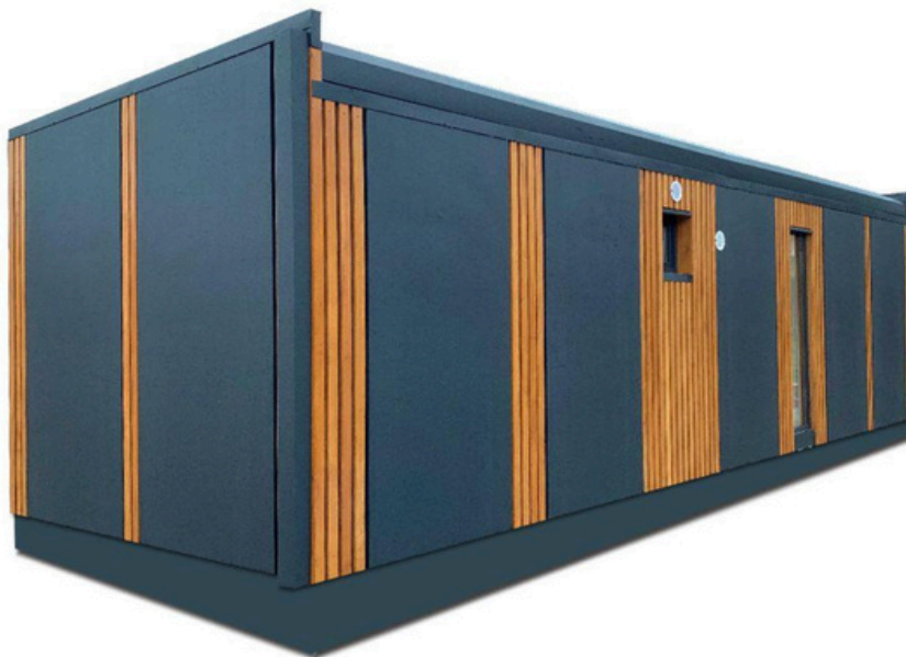
Vue arrière 1