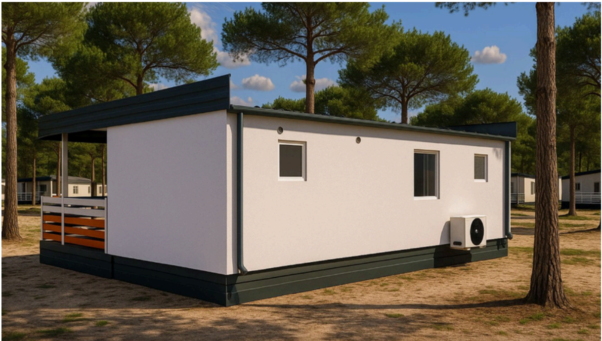
Vue arrière 1