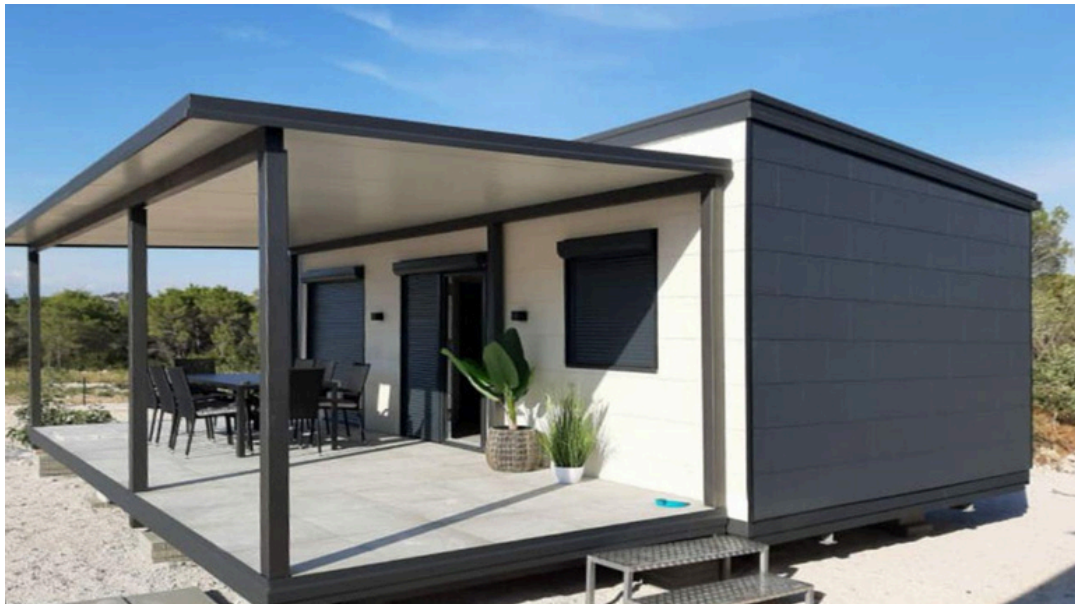
Vue de face 2