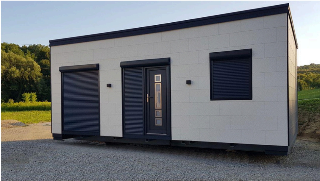
Vue de face 1