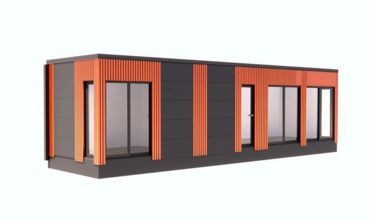
Vue de face 1