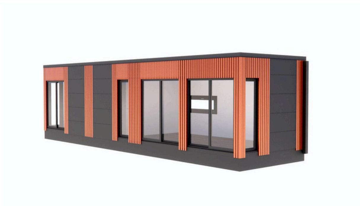
Vue de face 2