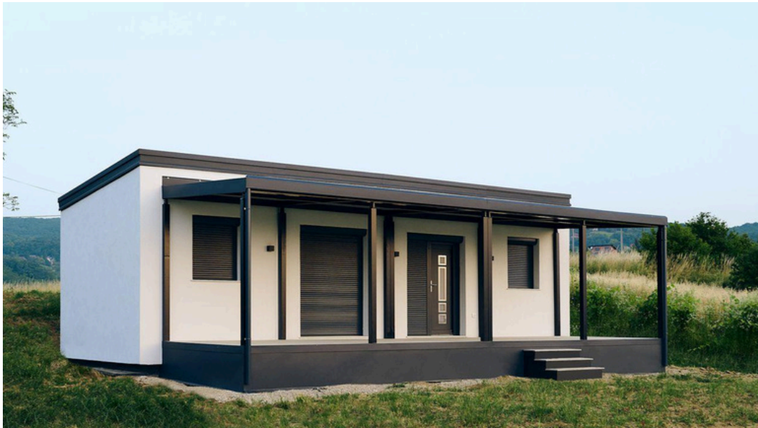
Vue de face 3