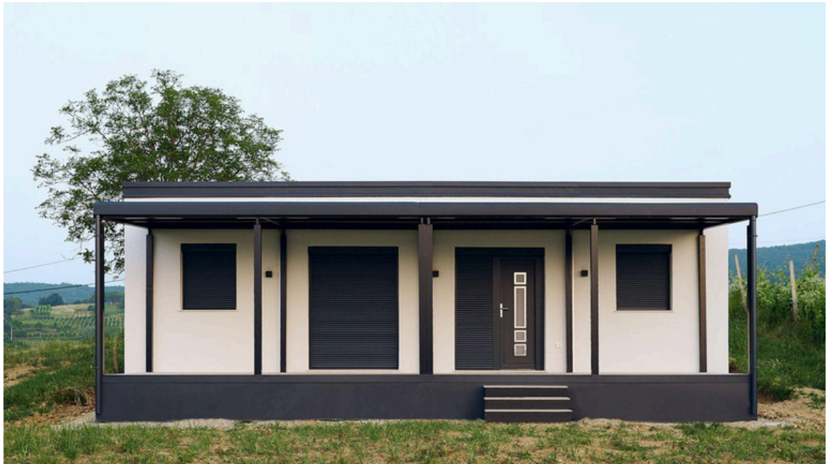
Vue de face 1