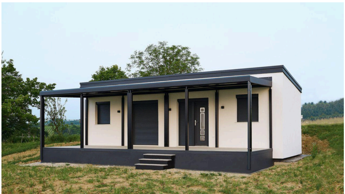
Vue de face 2