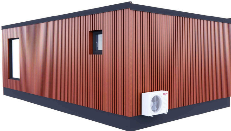
Vue arrière 1