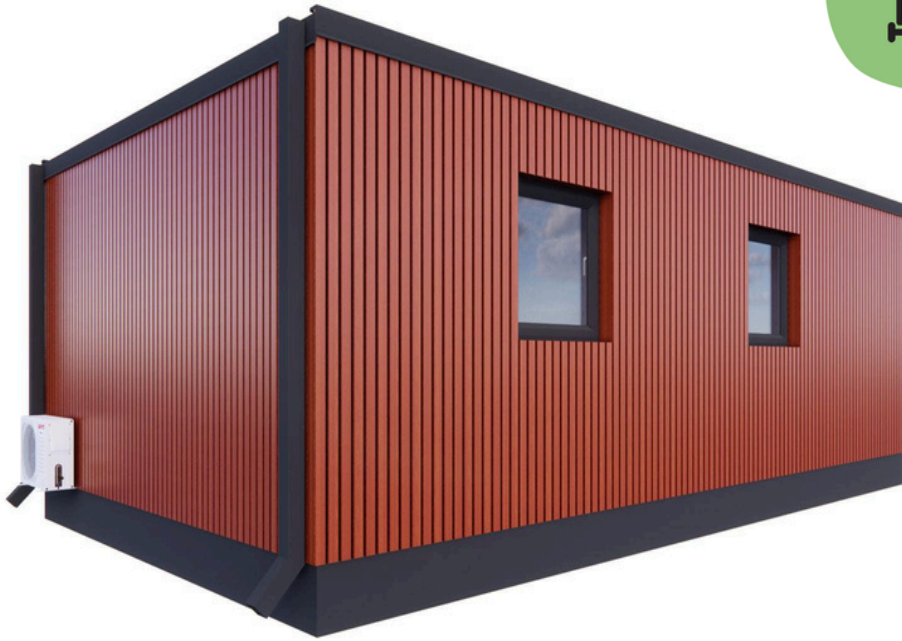
Vue arrière 2