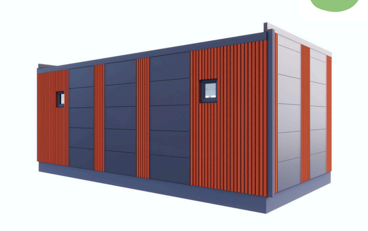
Vue arrière 2