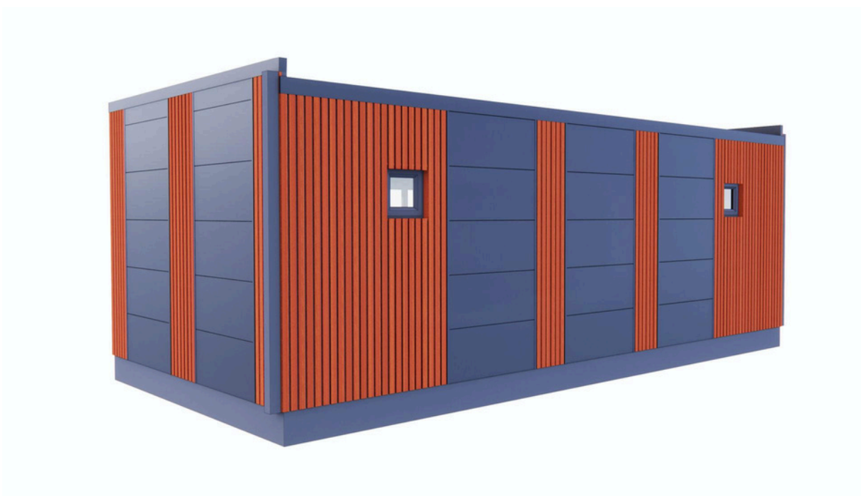
Vue arrière 1