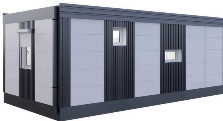
Vue arrière 1