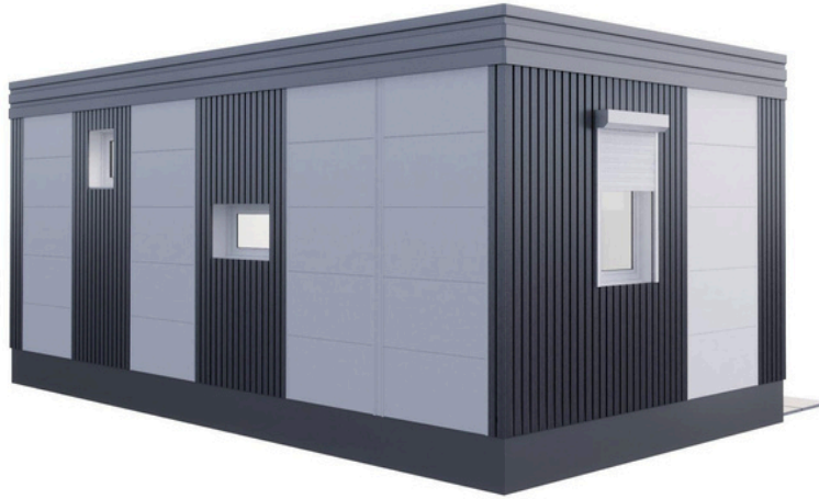
Vue arrière 2